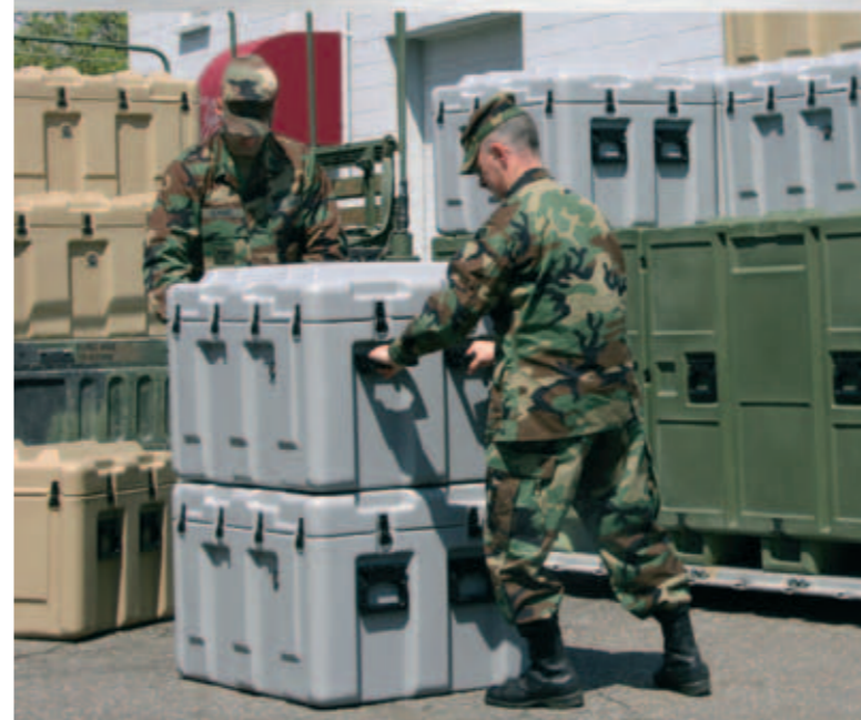
Contenedores de transporte extralargos