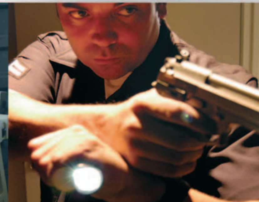
Sistemas de iluminación avanzados