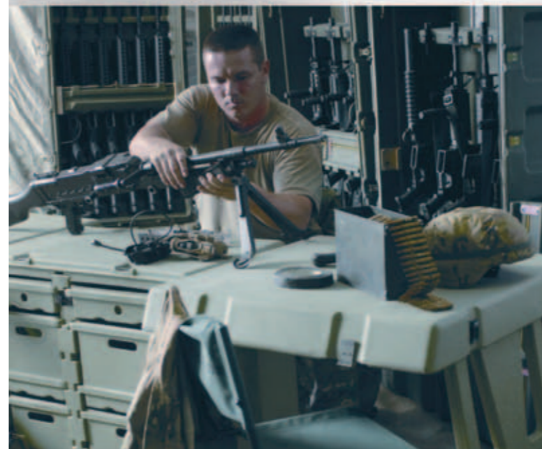
Soluciones de espacio de trabajo portátil