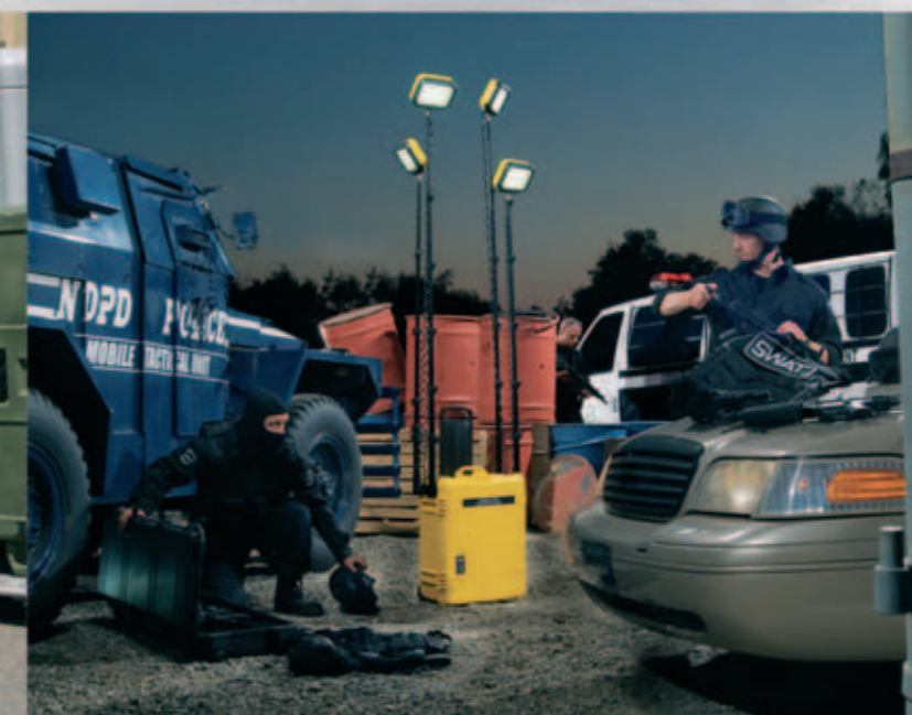
Sistemas de Iluminación para Áreas Remotas